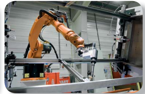
Schweißroboter für Standverteiler