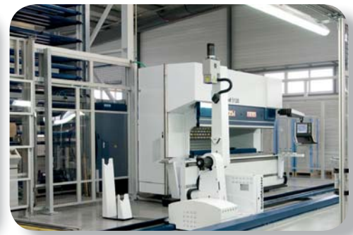
Biegezentrum TRUMPF - BENDMASTER