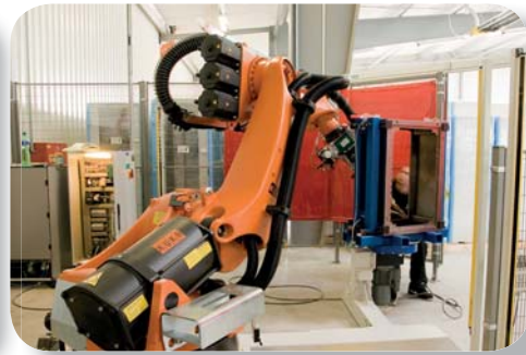
Schweißroboter für Wandverteiler